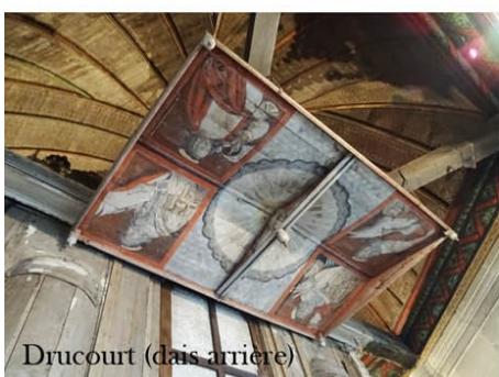
Drucourt (dais arriere)